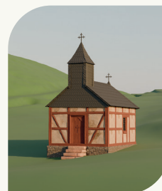
3D-Gebäudemodell der Kapelle

Mit der ARGO-App (Download über entsprechenden QR-Code) können Sie durch das Scannen der Renderbilder auf den Info-tafeln vor Ort das Dorf als authentische AR-Rekonstruktion virtuell wieder auferstehen lassen.