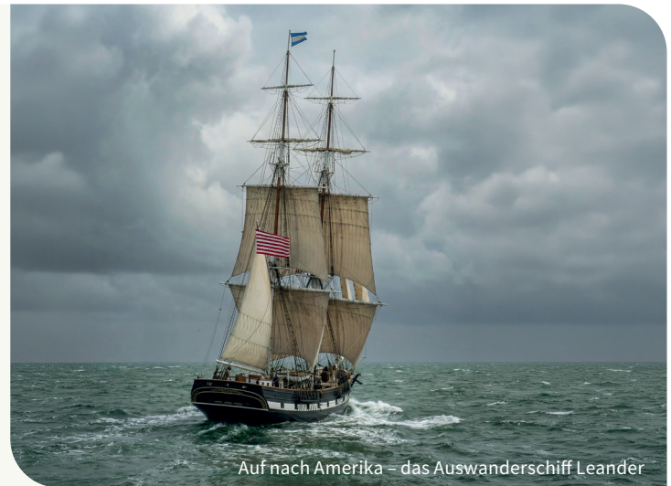
Auf nach Amerika – das Auswanderschiff Leander

Zusätzlich zur AR-Rekonstruktion erwarten die Besucher zwei aufwändig produzierte Minihörspiele, die die Strapazen der Auswanderung eindringlich schildern. Das Team Elektra Audio aus Montabaur produzierte die Hörspiele in Zusammenarbeit mit der Agentur Lindner & Steffen. Über die Plattform pickablue® werden sie eingebunden und erweitern das digitale Erlebnis um eine atmosphärische Audioebene.